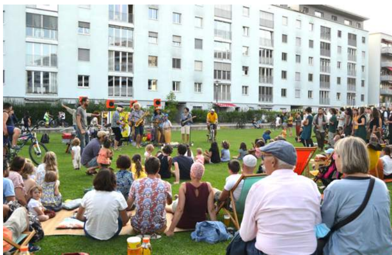
Cyclo-concert de Saraka, Péroilles 20 juillet 2021.

Pour donner une dimension festive à la tournée, au moins trois événements culturels professionnels étaient programmés par étape : 1 atelier de création artistique, 1 show de rue et 1 concert prévu en acoustique ou sur le Cyclotone – ce système où des cyclistes produisent l'électricité nécessaire à la sonorisation des musicien-ne-s.