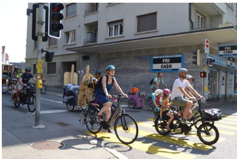
La parade du 15 août 2021, pour relier Jura et Péroilles.

Tout en sensibilisant à la mobilité douce, ces cortèges ont été tracés, puis autorisés par la Police locale, encadrés par une team « Titane » en fluo, afin que les participant·e·s circulent en toute sécurité. Ils se sont révélés être un incroyable moyen de promotion en ville de Fribourg, une fantastique aventure pour les cyclistes. Les CHARRETTES! ont pu compter sur le savoir-faire du collectif Faites du vélo pour mener à bien cette entreprise.