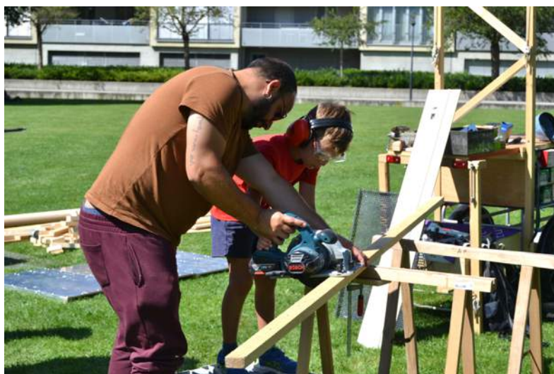
Chantier à Pérolles.

Notre équipe a également travaillé avec des adolescent-e-s, sur la fabrication préalable des charrettes, en juin. Une dizaine de jeunes en lien avec 2 institutions fribourgeoises se sont engagés pour leur construction à la Ressourcerie .