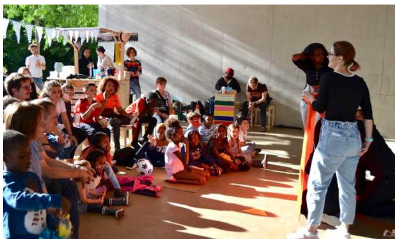
Théâtre d'impro par le Collectif d'abord, Schönberg 13 juillet 2021.

Les événements programmés par Espace-Temps étaient l'invitation à se déplacer entre quartiers et aller à la rencontre de leur population. Une buvette d'appoint, accessible les vendredis et samedis soirs, a permis d'accueillir le public en convivialité.