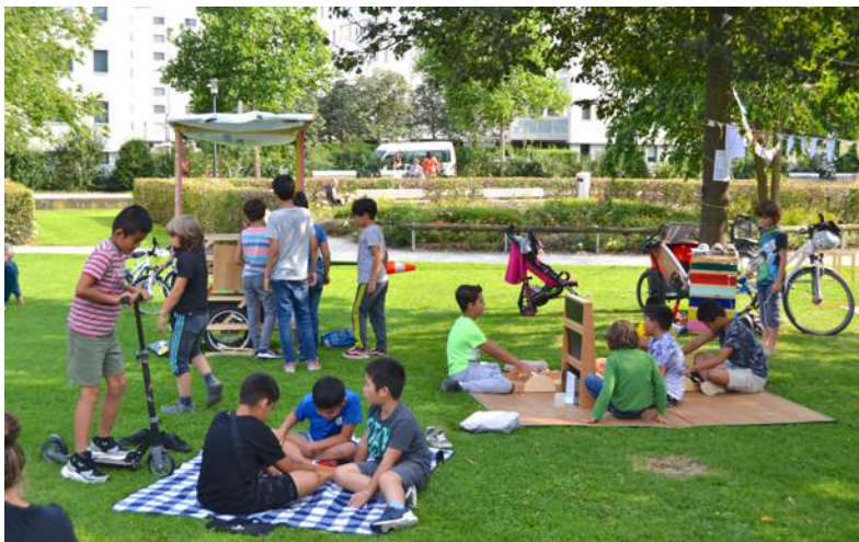
Accueil libre à Péroilles.