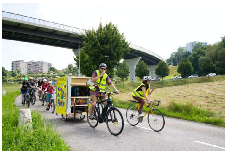
La parade à vélo du 18 juillet 2021, pour relier Schönberg et Basse-Ville.

Étape 4 | 18 au 21 août | Péroilles – Domino