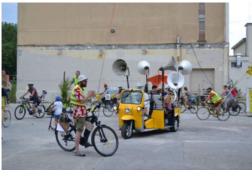
Parade inaugurale avec le tuk tuk sonorisé, 10 juillet 2021.