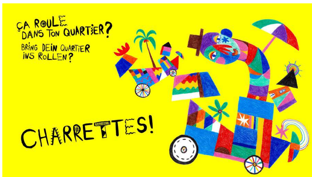
Visuel 2021

La Liberté – 26.07.2021 – « Le Schoenberg s'anime à l'improviste » : www.associationespacetemps.ch/charrettes La Liberté – 26.08.2021 – « CHARRETTES! ça roule dans ton quartier » : www.facebook.com/laliberte.ch/videos/169959348483347