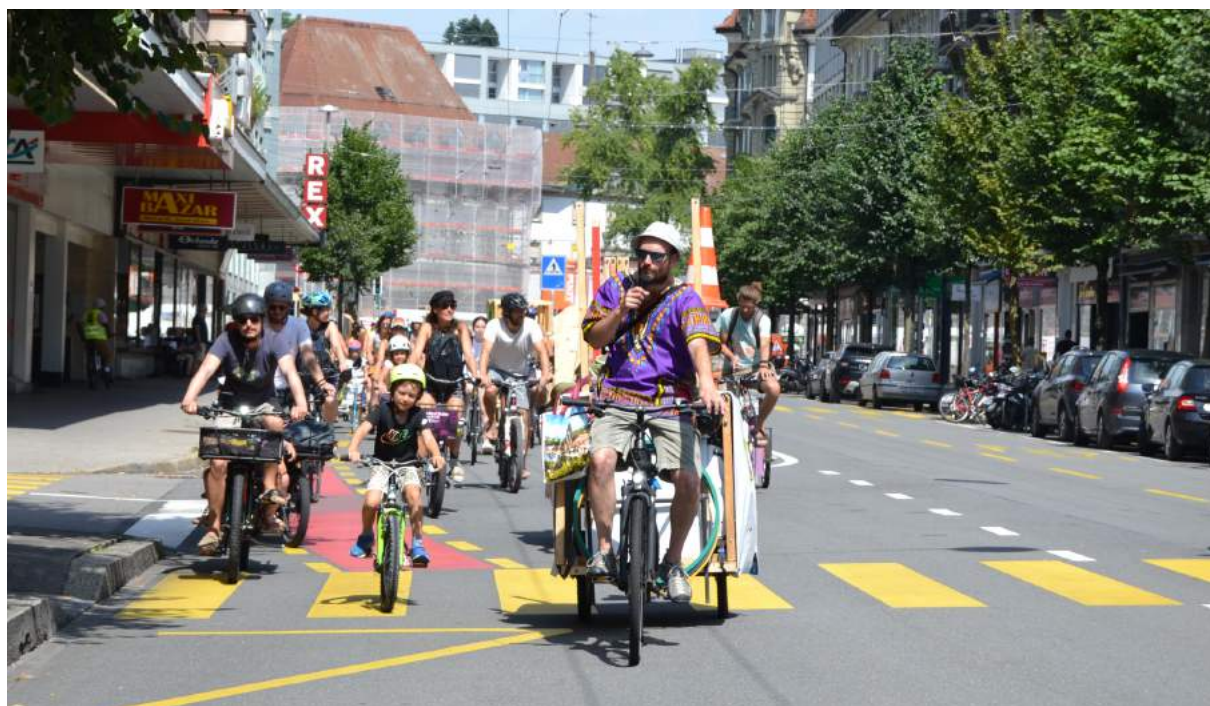
La caravane des CHARRETTES! paradant entre les quartiers du Jura et de Pérolles, 15 août 2021.