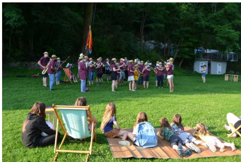
La Lyre aux Grandes-Rames, 22 juillet 2021.

En 2021, ce sont 3'000 personnes (sur 20 jours d'activation), qui ont pris part à nos festivités et usé de notre infrastructure. 40 partenaires ont contribué à créer le contenu de la programmation estivale des CHARRETTES! à découvrir sur www.associationespacetemps.ch