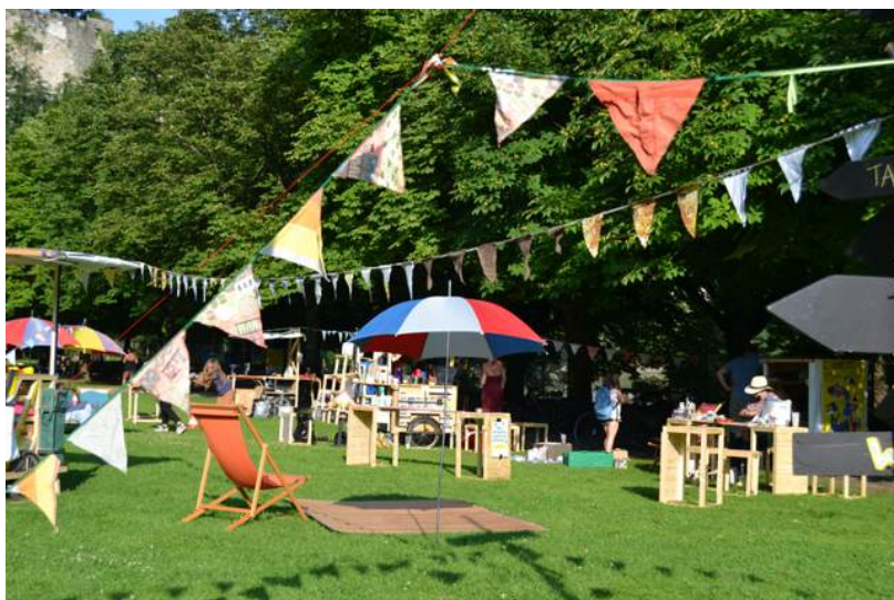
Dispositif aux Grandes-Rames, juillet 2021.

Le nouveau site web des CHARRETTES! présentera en avril l'éventail des remorques à emprunter, ainsi que les informations relatives à leur mutualisation. Nous visons une dizaine de nouveaux prêts, d'ici à l'automne 2022.