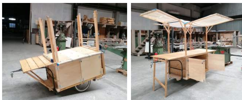
La charrette JTM déployée, co-construction terminée à l'automne 2021.

Toutes ces CHARRETTES font partie d'un parc collectif, à la disposition des acteur-trice-s socioculturel-le-s de la région. A l'entre-saison, elles sont mutualisées et prêtées à d'autres organismes ou associations, afin qu'ils puissent à leur tour animer des événements fédérateurs en extérieur.