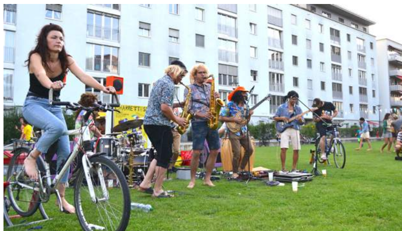
Le groupe Saraka, sonorisé à la force des mollets, 20 août 2021.

Nous nous réjouissons finalement de proposer des ateliers de construction ouvert durant notre tournée dans les quartiers, favorisant l'inclusion, indépendamment de son genre ou de son âge.